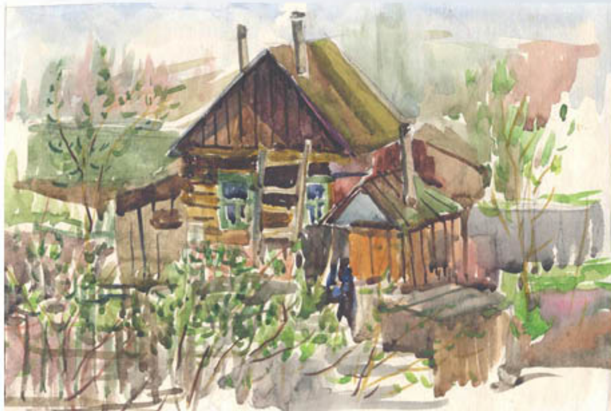
• Старый дом, Уфа (бумага, акварель)