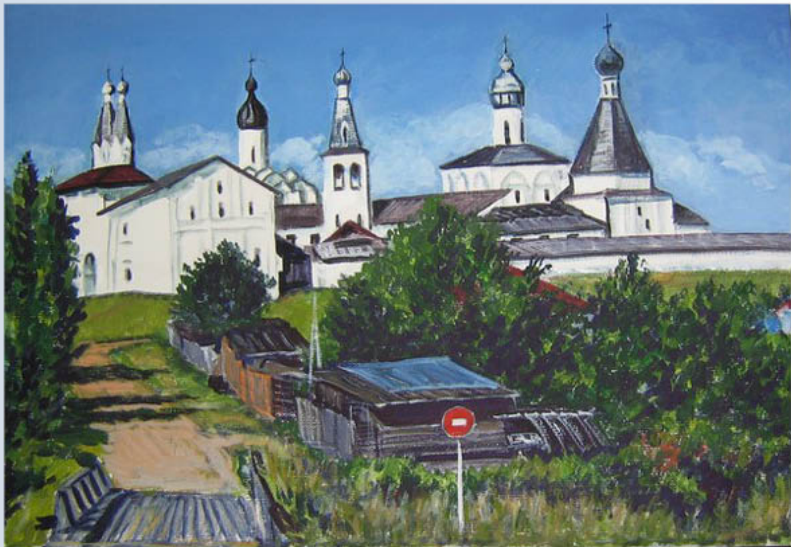
• Свято-Троицкий храм, Володые (холст, темпера)